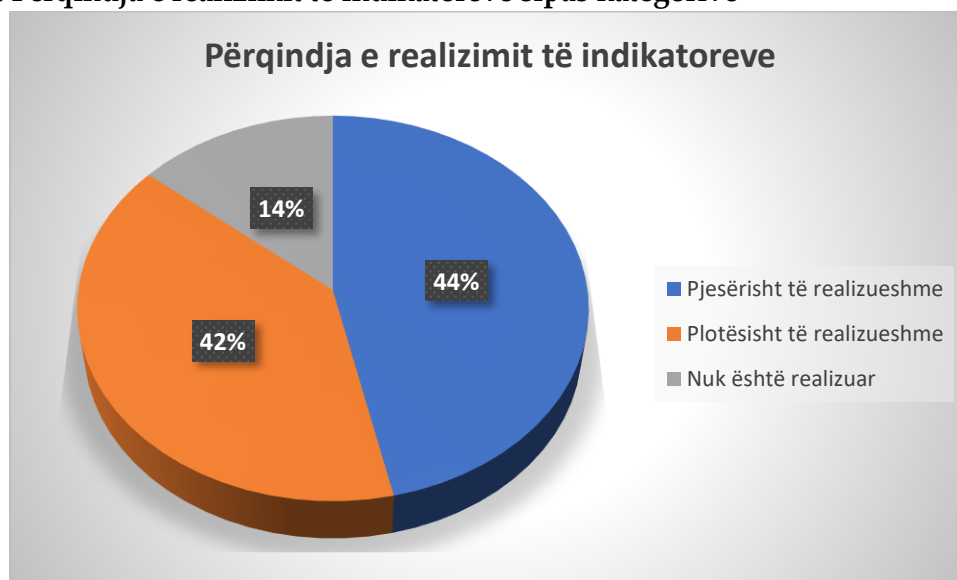
Figura 4. Përqindja e realizimit të indikatorëve sipas kategorive

Sipas vlerësimit të zbatimit të Strategjisë Sektoriale, nga gjithsej 43 indikator të paraparë, 18 indikator apo 42 % janë cilësuar si “plotësisht të realizuara” , 6 indikator nuk janë realizuar , që përbëjnë 14% e të gjithë indikatorëve të planifikuar të Strategjisë. Ndërsa 44% e të gjithë indikatorëve janë “realizuar pjesërisht” , apo 19 nga 43 indikator Për më tepër informata shih figurën e mëposhtme.