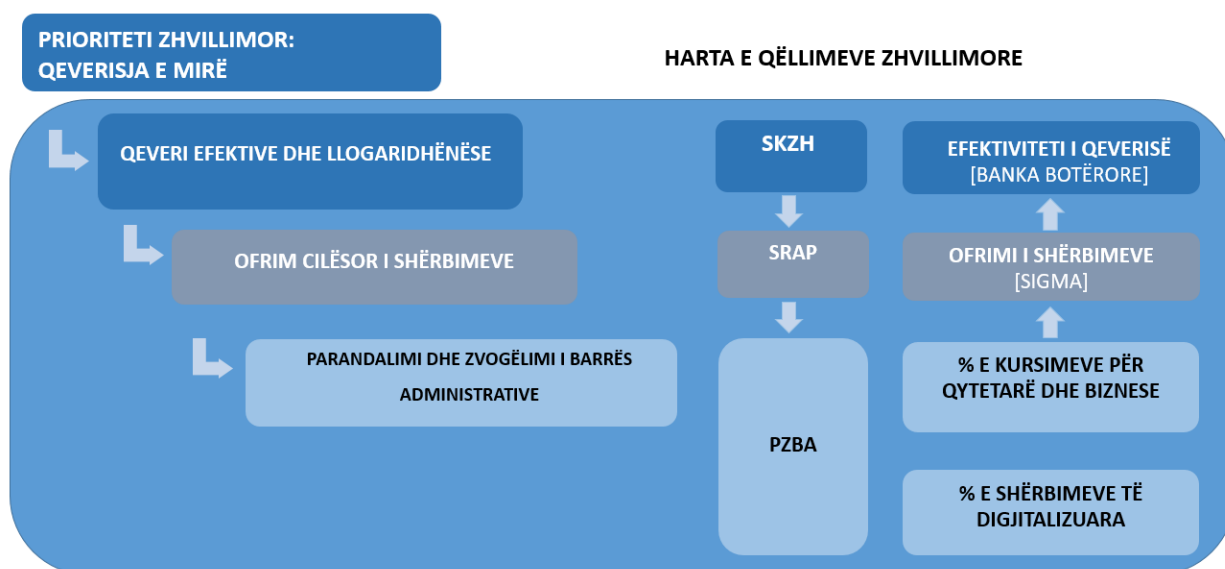
Figura 1 Harta e qëllimeve e ndërlidhur me kornizën strategjike dhe tipet e treguesve

Qëllimet dhe synimet e shprehura në Program, do të kuantifikohen dhe operacionalizohen me masa dhe veprime konkrete në Planin e veprimit.