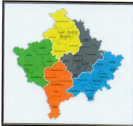
Figura 3. Harta e Kosovës sipas Klasifikimit NUTS 3

Klasifikim të territorit me NUTS 3 kanë këto shtete: